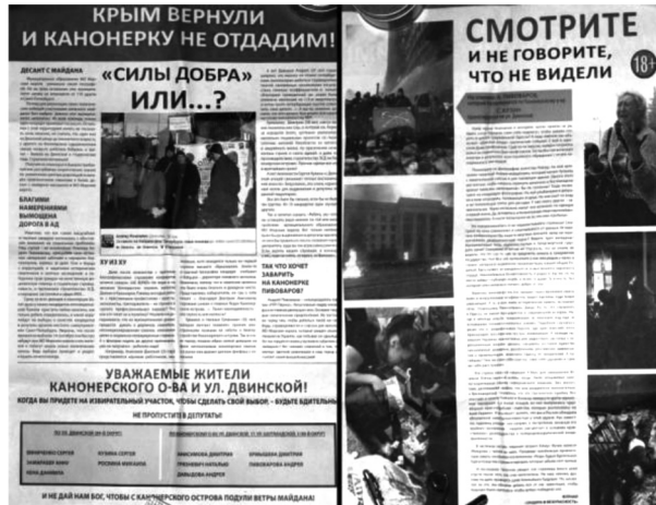
Рис. 2. «Антиопозиционные» листовки

К наиболее успешной контрриторической стратегии «Единой России» можно отнести апелляцию к теме украинского Майдана, в котором принимало участие несколько оппозиционных кандидатов. В последнюю неделю перед выборами по почтовым ящикам жителей округа были распространены листовки с заголовками: «Крым вернули и Канонерку не отдадим!», «И не дай нам Бог, чтобы с Канонерского острова подули ветры Майдана!» и фотографиями оппозиционеров «на баррикадах» (рис. 2).