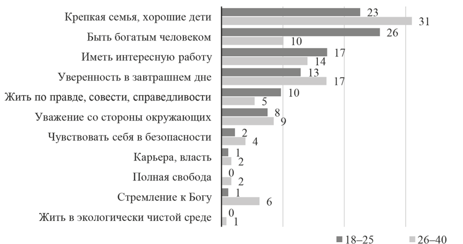
Рис. 5. Распределение ответов на вопрос: «Что из нижеперечисленного важно для Вас лично?» (в % от опрошенных по возрастам)

Исходя из всего сказанного, представляется вероятным, что такие взгляды будут характерны для нового поколения узбекских мигрантов, которые, переезжая в другие страны и вступая в контакт с новым обществом, проявят повышенную открытость и мультикультурные тенденции.