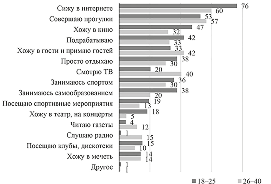
Рис. 6. Распределение ответов на вопрос: «Чем Вы занимаетесь в свободное от основной работы время?» (в % от опрошенных по возрастам)

стана в московской агломерации является пространство досуговых практик. Среди основных занятий узбекских мигрантов в возрастной категории от 18 до 25 лет наиболее популярными являются использование интернета (76,3%), прогулки на свежем воздухе (52,7%), посещение кинотеатров (47,3%), временная работа для дополнительного заработка (41,9%), самостоятельное обучение (37,6%), игра в компьютерные игры (28%) и хождение на театральные спектакли и концерты (18,3%). Миллениалы, в отличие от постмиллениалов, больше склонны к использованию традиционных видов медиа, таких как телевидение (40,3%), радио (14,7%) и газет (11,6%). Однако, несмотря на некоторые выраженные различия, в целом структура досуга у обоих поколений остается схожей (рис. 6).