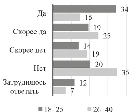
Рис. 3. Распределение ответов на вопрос: «Можете ли Вы представить ситуацию, что назовете своего ребенка русским именем?» (в % от опрошенных по возрастам)

В то же время для людей в возрасте от 18 до 25 лет критичной является проблема доступа к качественному образованию в Узбекистане (14%). Среди более взрослой категории мигрантов основными мотивами для переезда становятся низкий уровень доходов (45,7%) и отсутствие рабочих мест на родине (30,2%). Таким образом, младшее поколение стремится найти решение проблемы отсутствия перспектив, в то время как старшее — решить экономические трудности, такие как низкие зарплаты и безработица, уже на территории России. В возрастной категории от 18 до 25 лет больший процент постмиллениалов занят в секторе услуг и торговли, составляя 38,7 и 21,5 % соответственно, в то время как в возрастной группе от 26 до 40 лет эти показатели ниже — 27,9 и 17,8 %. В то же время среди миллениалов более старшая возрастная группа чаще работает в строительстве и на транспорте, с долями в 20,2 и 13,2 % против 8,6 и 6,5 % у молодежи соответственно.