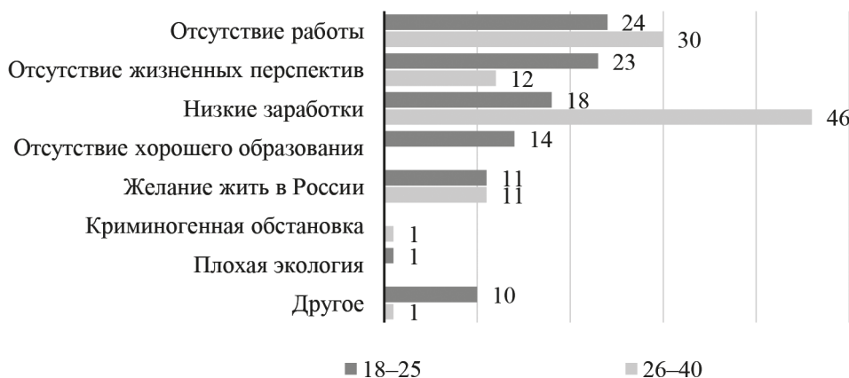
Рис. 1. Распределение ответов на задание: «Назовите основные причины приезда в Россию» (в % от опрошенных по возрастам)

Для молодых мигрантов отсутствие возможностей для работы (23,7%) и перспектив на родине (22,6%) является ключевым стимулом для переезда в Россию.