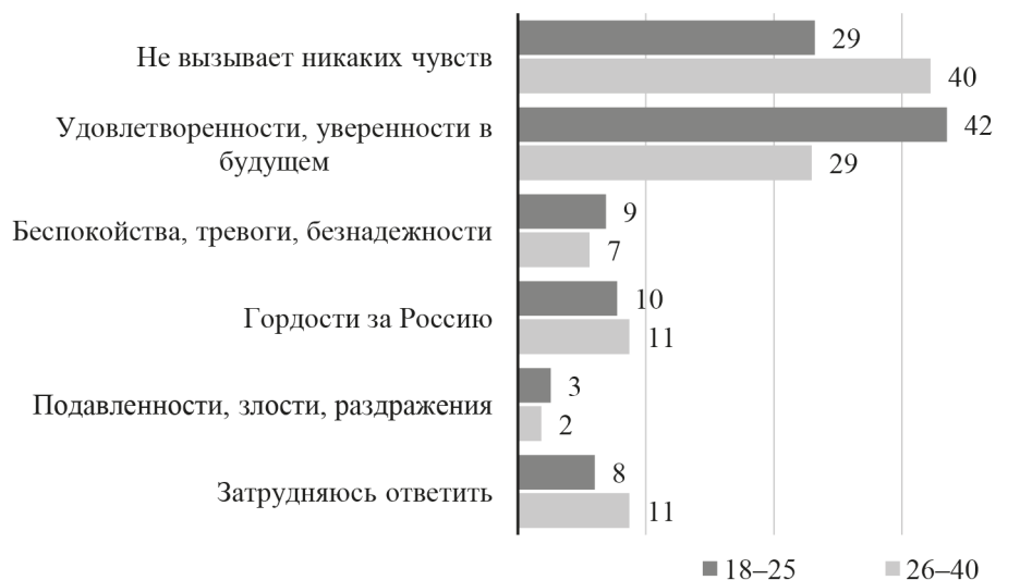
Рис. 7. Распределение ответов на вопрос: «Какие настроения и чувства вызывает у Вас миграционная политика России и Москвы?» (в % от опрошенных по возрастам)

оценках миграционной политики России и Москвы по отношению к трудовым мигрантам из Узбекистана (рис. 7).