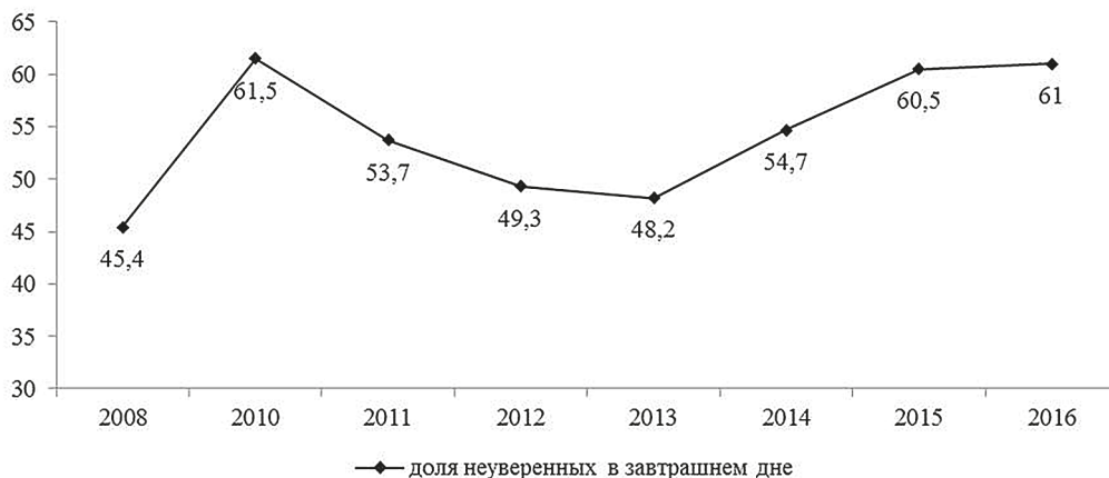
Рис. 3. Доля жителей Вологодской области, сталкивающихся с проблемой неуверенности в завтрашнем дне в 2008–2016 гг., в % от числа опрошенных

Социальная адаптация населения к негативным изменениям окружающей действительности во многом характеризуется таким индикатором социального самочувствия, как степень уверенности в завтрашнем дне. По данным опроса общественного мнения ВолНЦ РАН, с 2008 по 2016 г. наблюдается рост доли жителей области, не уверенных в завтрашнем дне (на 16 п. п.: с 45 до 61 %), при этом негативная динамика оценок заметна в кризисные периоды (с 2008 по 2010 г. на 17 п. п., с 2013 по 2016 г. — на 13 п. п.; рис. 3). Следует подчеркнуть, что ощущение неуверенности в будущем в годы экономического кризиса характерно для большей части населения (примерно для 50–60 %).