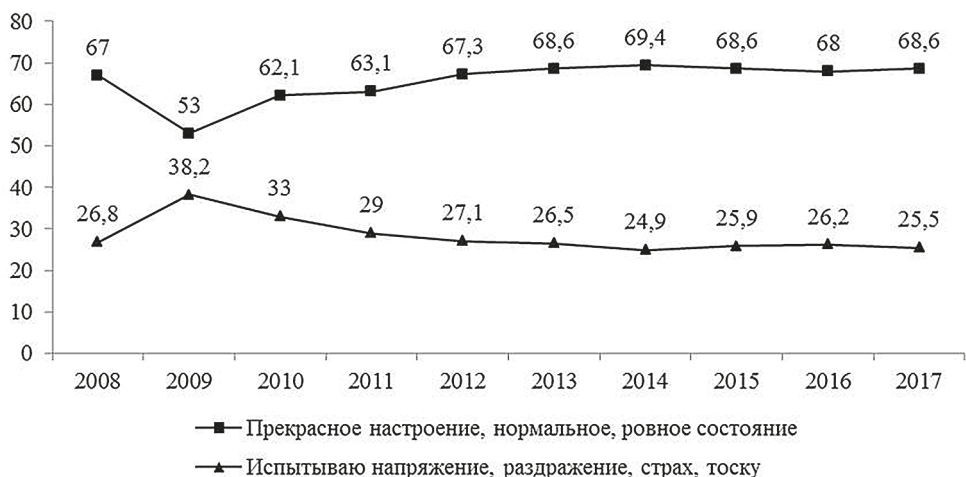
Рис. 1. Динамика социального настроения населения Вологодской области, в % от числа опрошенных