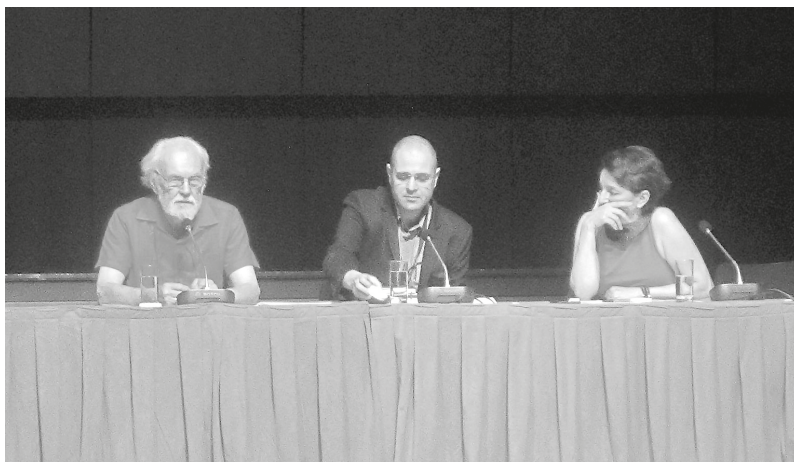
Рис. 1. Первое пленарное заседание 13-й конференции ESA. Слева направо: Дэвид Харви (Городской университет Нью-Йорка), Кристиан Фукс (Вестминстерский университет), Ева Иллуз (Еврейский университет в Иерусалиме)

Как правило, на первом пленарном заседании, на открытии конференции, звучат доклады, которые задают тон всей конференции и призваны обозначить основные реперные точки. Пленарное заседание началось с обращения президента ESA, австрийского социолога Франка Вельца. В своей остроумной речи он упомянул Грецию как родину европейского мышления и как специалист по теоретической социологии не преминул отметить, что это мышление переживает кризис, а соответственно и социология как способ мышления тоже находится в кризисном состоянии. Мышление социологов разворачивается на фоне таких политических действий, как политика жесткой экономии и неолиберализм, и таких общественных реакций, как национализм, ксенофобия и правый экстремизм. Внутрисоциальные неравенства усиливаются интерсоциетальными дисбалансами и больше не могут быть отрегулированы исключительно экономическими мерами без обращения к «социальному». В то же время в самом социологическом сообществе все больше распространяются прекарнизация карьер, количественная оценка исследований и жесткая конкуренция за ресурсы. Перед лицом коммерциализации науки социологи должны объединить усилия, чтобы решить, как реанимировать саму идею и практику науки как группы единомышленников. В контексте сокращения ресурсов на социальные исследования, которое прикрывается риторикой «инноваций», необходимо более активно бороться за место социальной науки в исследовательской политике Европейского союза.