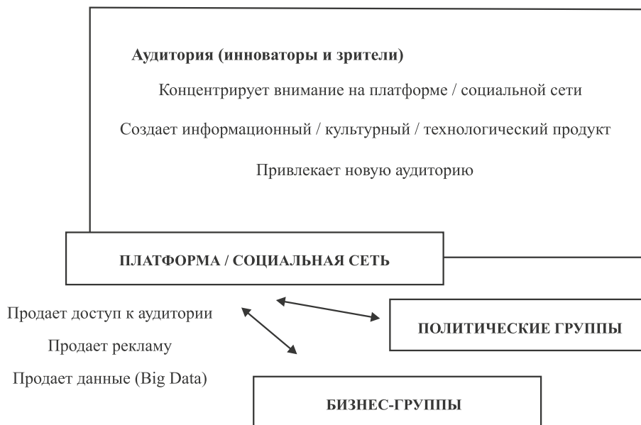
Рис. 2. Накопление экономического капитала путем конвертации коммуникативного капитала на макроуровне

Практики, которые используют собственники платформы для максимизации дохода, таким образом, заключаются в следующем: