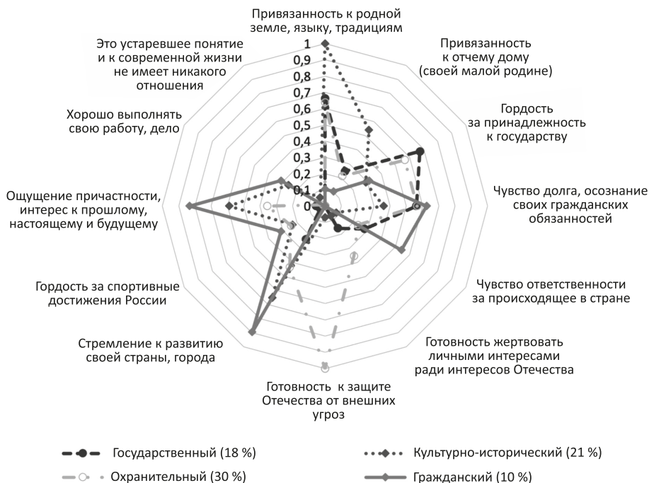
Рис. Кластеры и соответствующие им содержательные профили патриотизма (по результатам опроса 2023 г.)

наблюдаются минимальные показатели гражданственности и уровня гражданской активности (38 % не имеют опыта гражданского участия за последние два года).